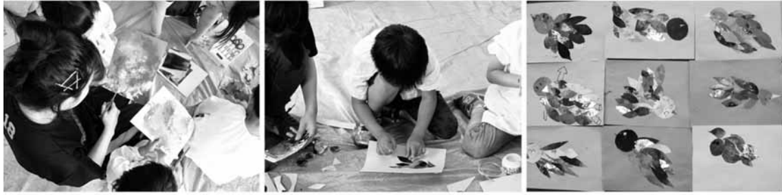
図1-1 合同制作の様子