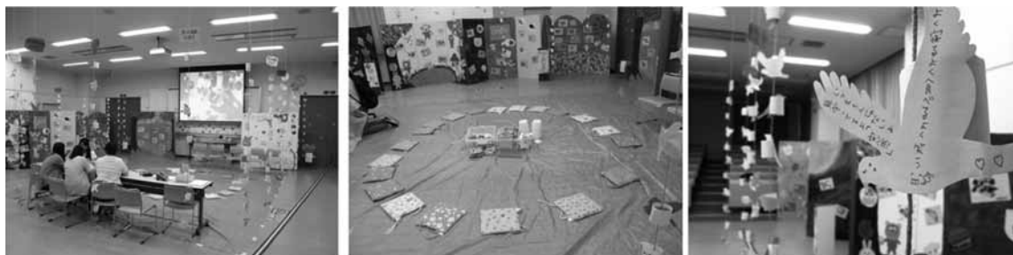
図1-2 展示会場の様子

屏風型のパネルの作品は、教室を囲うように配置した。置く順番は、見に来てくれた子ども達と保護者が自分の作品を探しやすいように園ごとに並べ、看板を立てた。「子ども達の幸せって何だろう？」のメッセージカードも園ごとに保護者・先生、または学生ごと、教員ごとと分け、天井から吊るして展示することにした。これにより、教室を周回して、園の看板を目指し子ども達の作品を探し見る道程でメッセージカードにも気づくと期待した。そして、制作過程の記録映像は教室の前方のスクリーン（図の映像1）で上映した。子ども達の声も大きく聞こえるようにし、制作風景を再現した。さらに学生が展示期間中に運営する制作体験ワークショップが教室の中央にくるようにし、そこで、同じ幸せの鳥を制作できるようになっている。